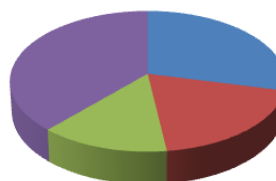
Dati Camera Arbitrale Milano 2020 mediazioni IP

■ contratti licenza 28,8% ■ tutela dei marchi 19,2% ■ diritto d'autore 13,7% ■ trasf. Tecnologico, sviluppo brevetti 38,3%